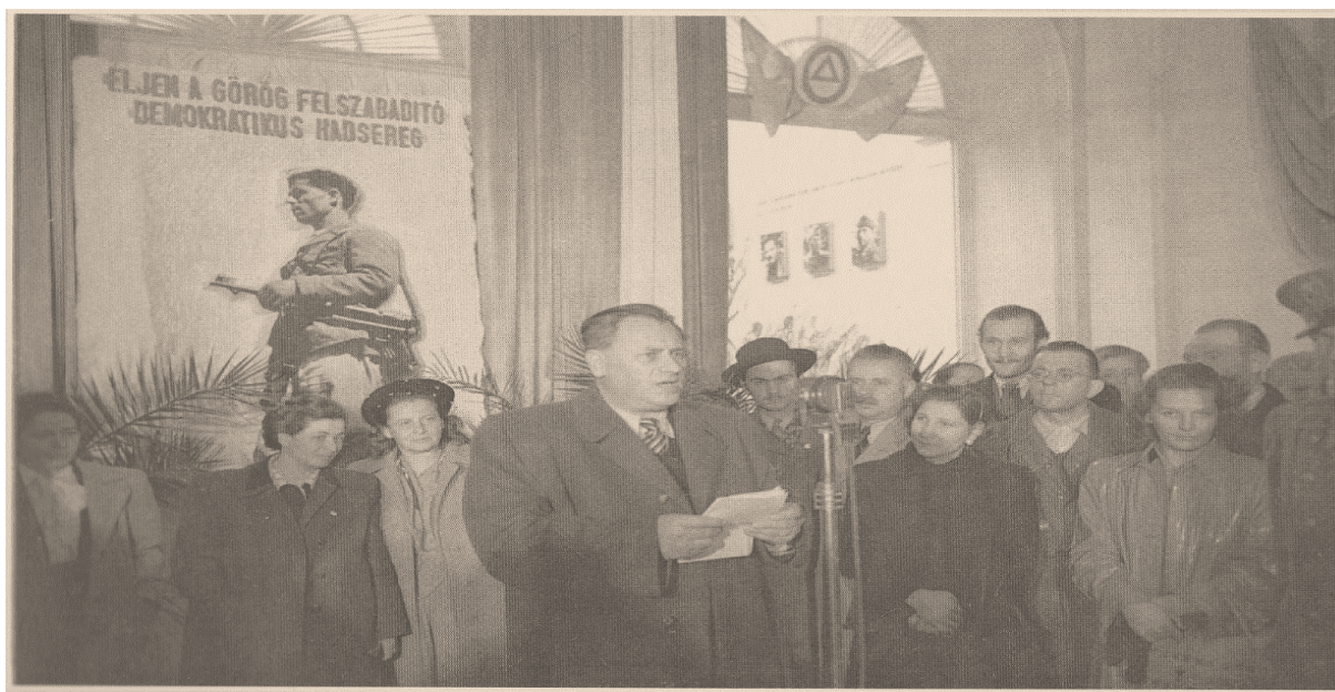
Fotó: Nógrádi Sándor államtitkár megnyitja a kiállítást a Fővárosi Képtárban (Köszönjük Magyarországnak! – Evharistume Ungaria! Budapest, 2006: 53)